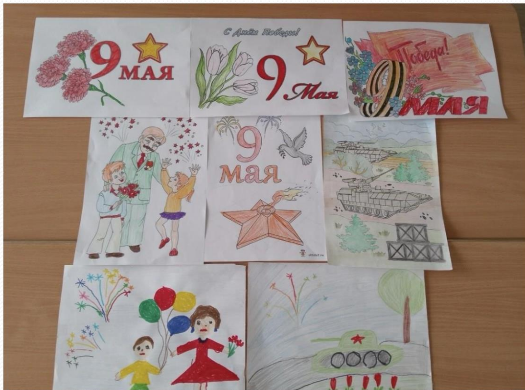
Акция «День Победы».