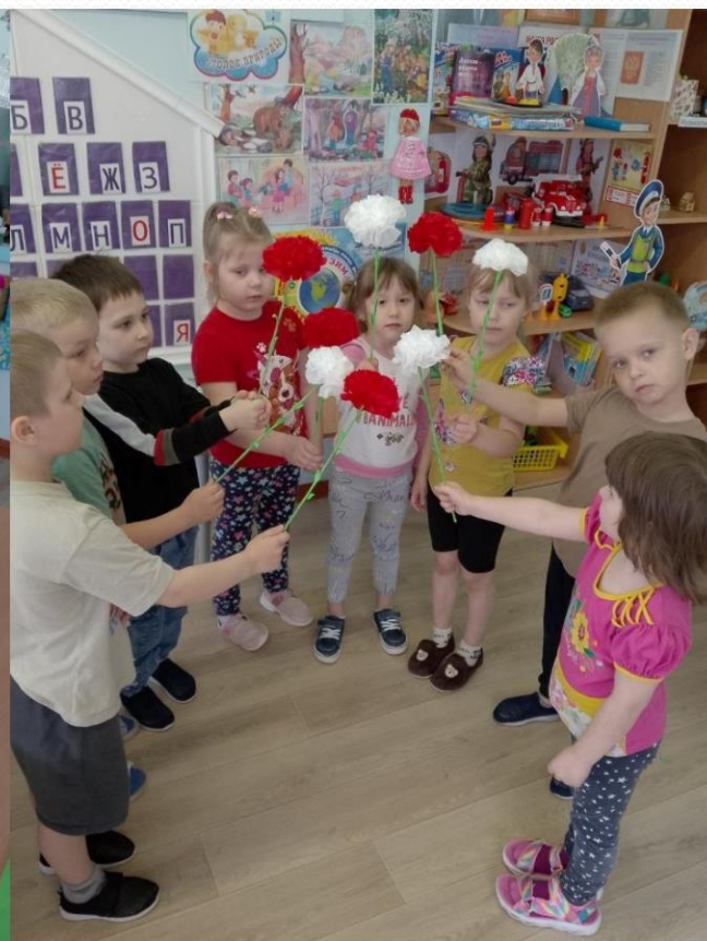
Акция «Цветок Победы».