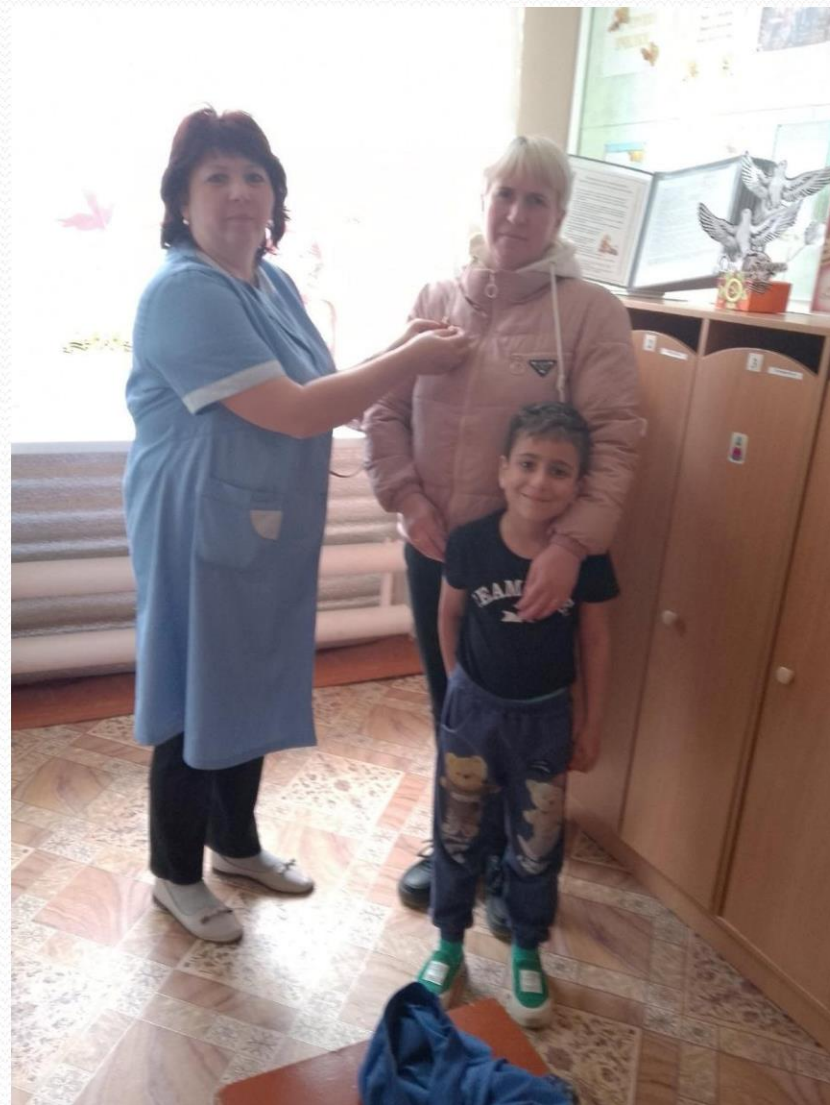
Акция «Георгиевская лента».