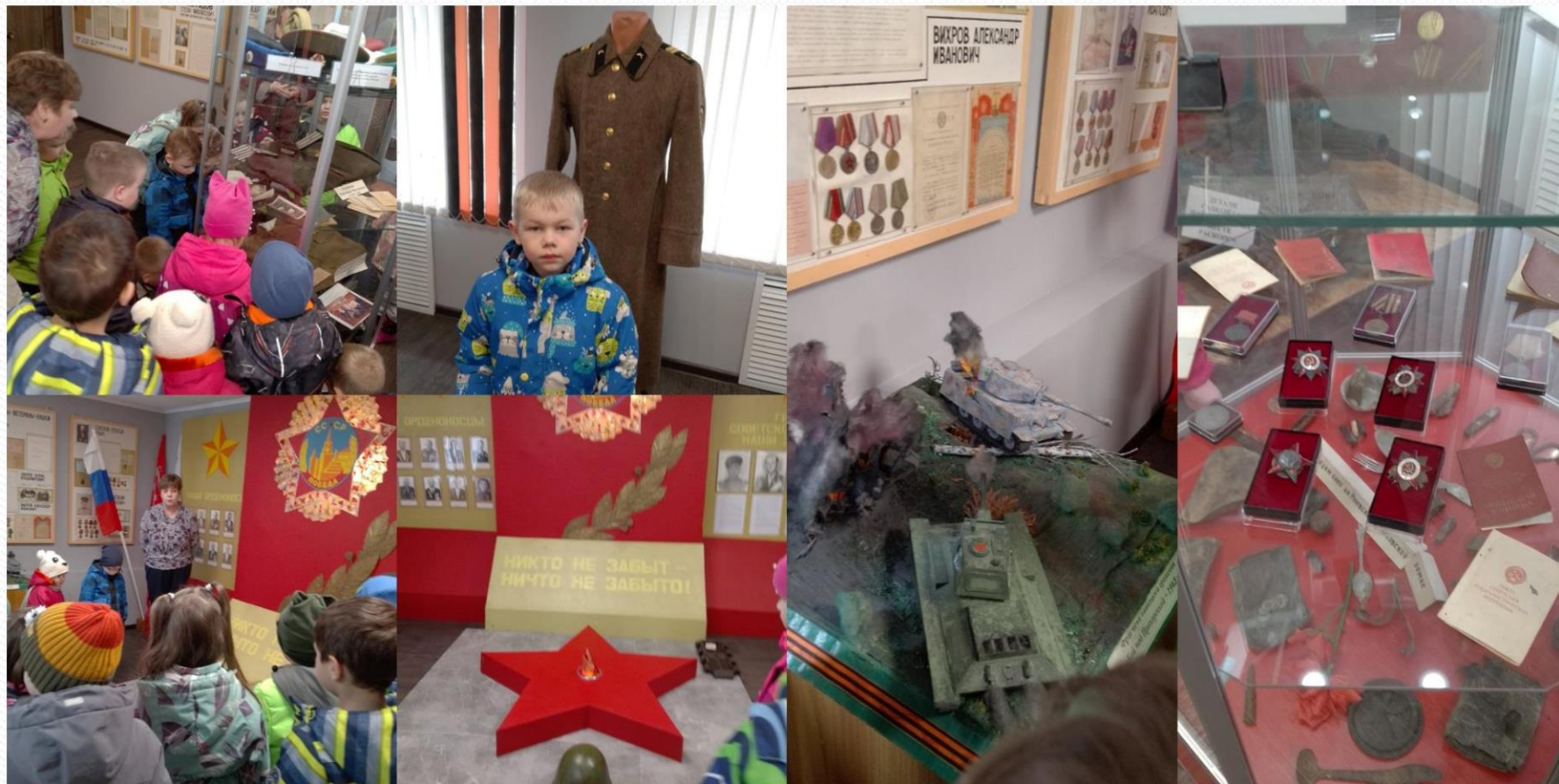
Зал боевой и трудовой славы