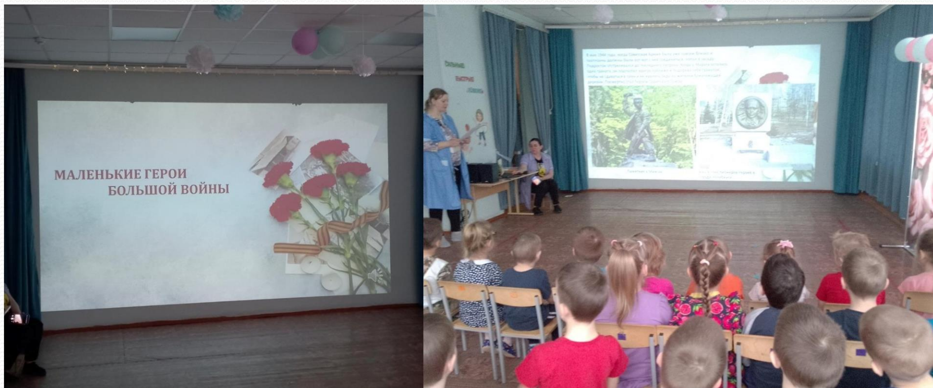
Просмотр документального фильма.