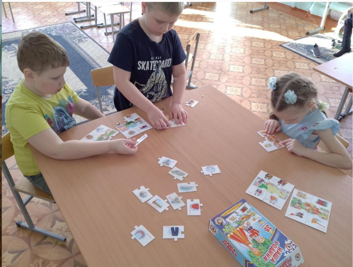
Дидактические игры «Наша Родина».