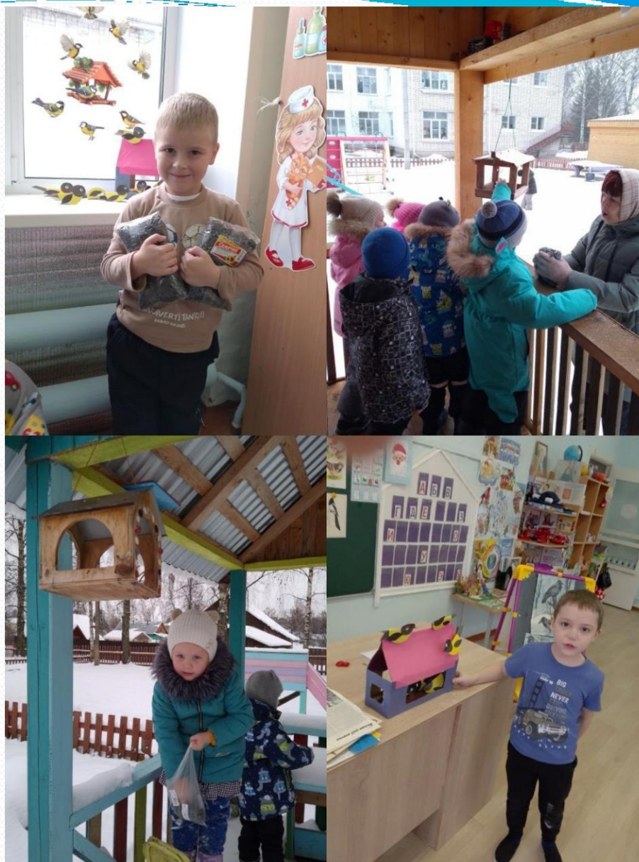
Акция "Покорми птиц"