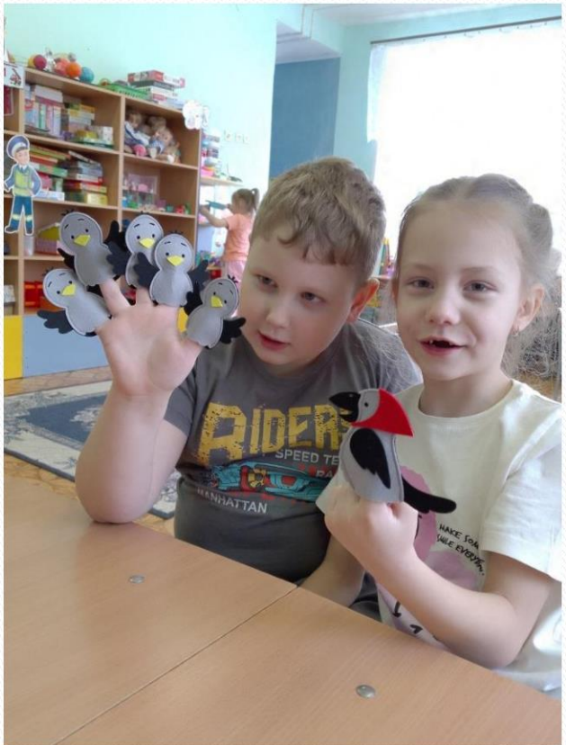
Знакомим детей с фольклором. Читаем сказки, потешки, былины.