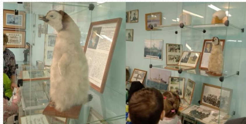
зал морской славы