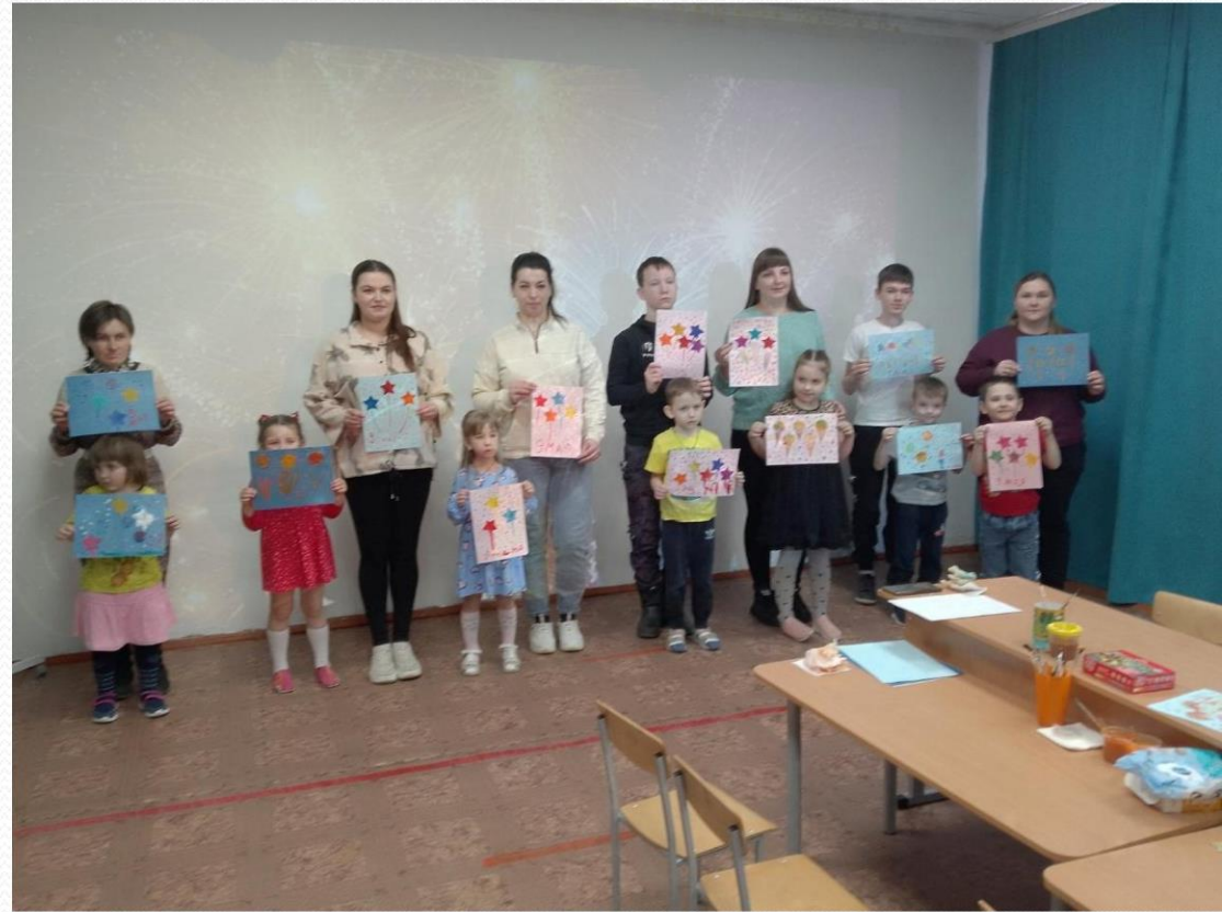
Мастер-класс с родителями "Салют победы".