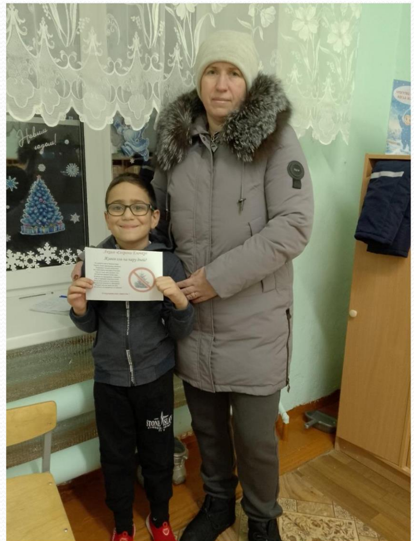
Консультация на патриотическую тему