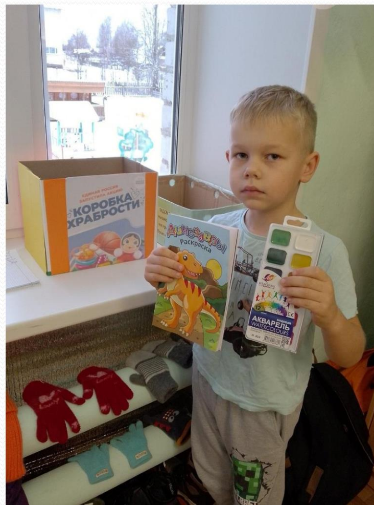
Акция «Коробка храбрости».