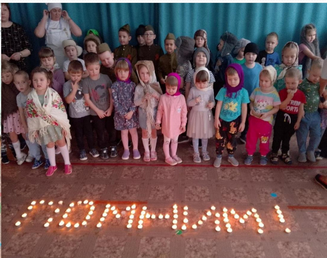
Акция "Блокадный хлеб".