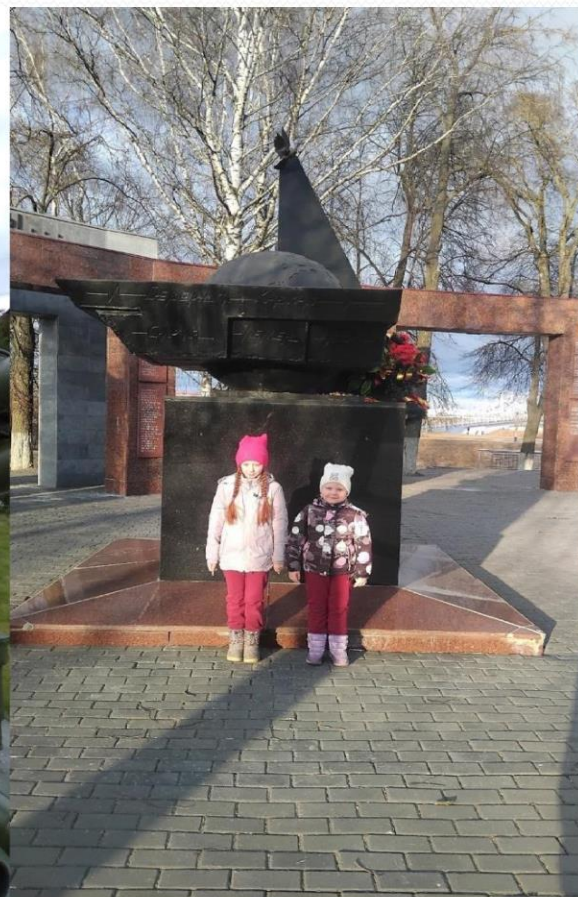
Родители знакомят детей с памятными местами родного края