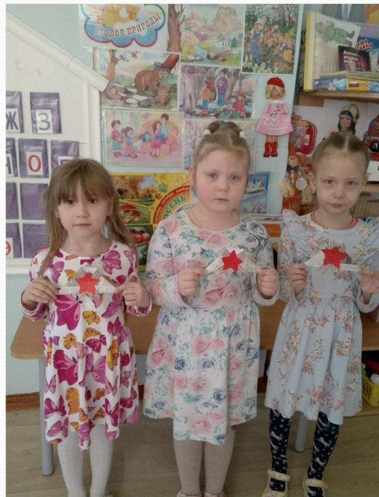
Акция "Письмо Победы».