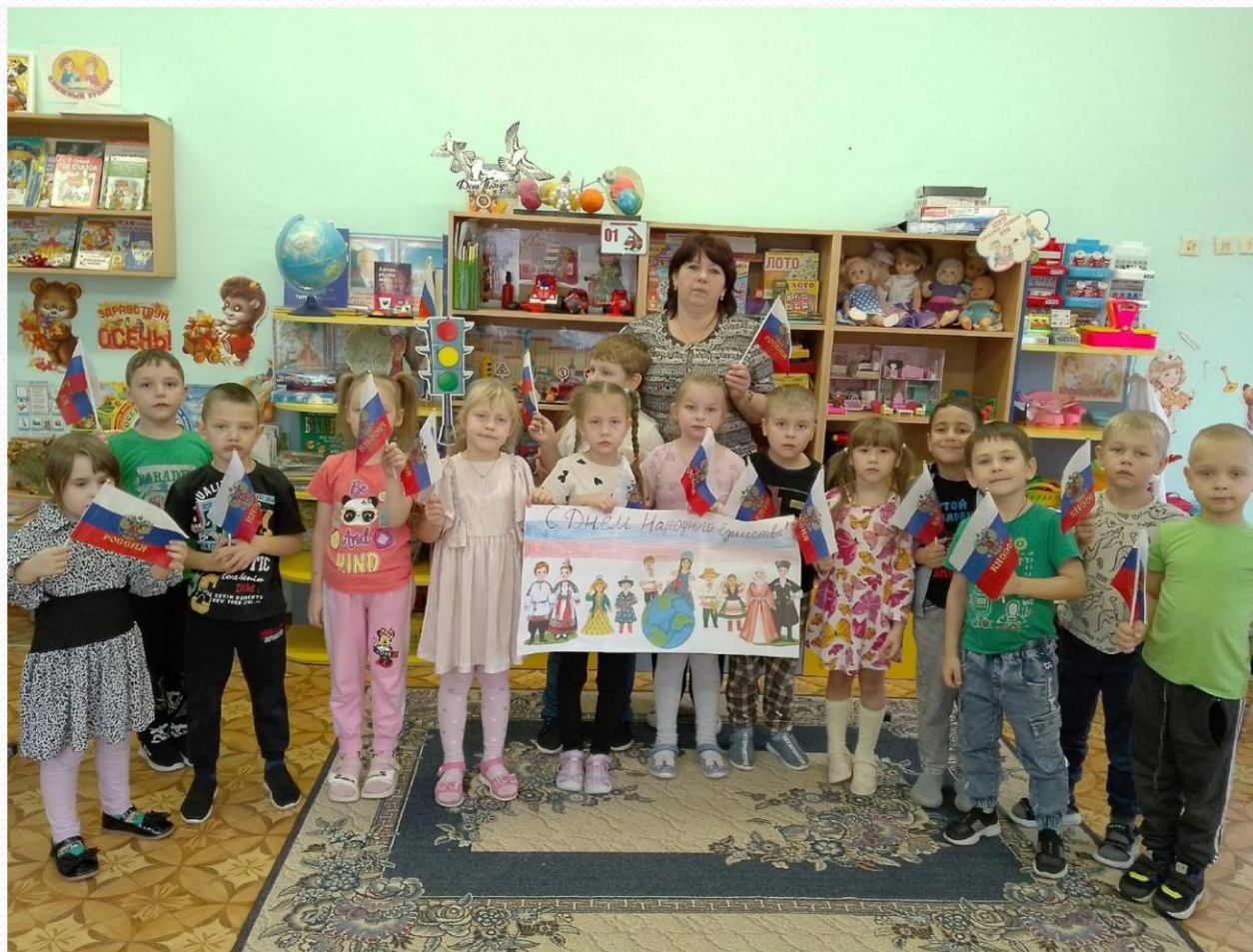
Акция "День народного единства".